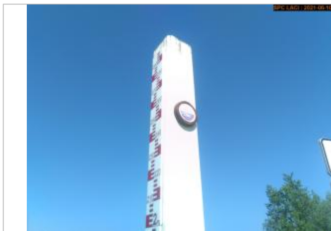
Vue du repère en 2021