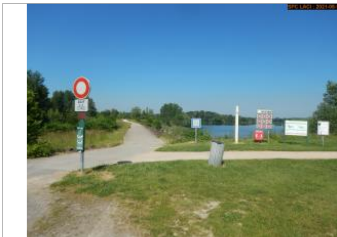
Vue du site en 2021

Coordonnées WGS84 : X: 2.48617108 / Y: 46.73438530