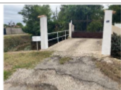
Passerelle d'accès aux propriétés privées