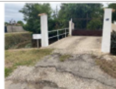
Passerelle d'accès aux propriétés privées