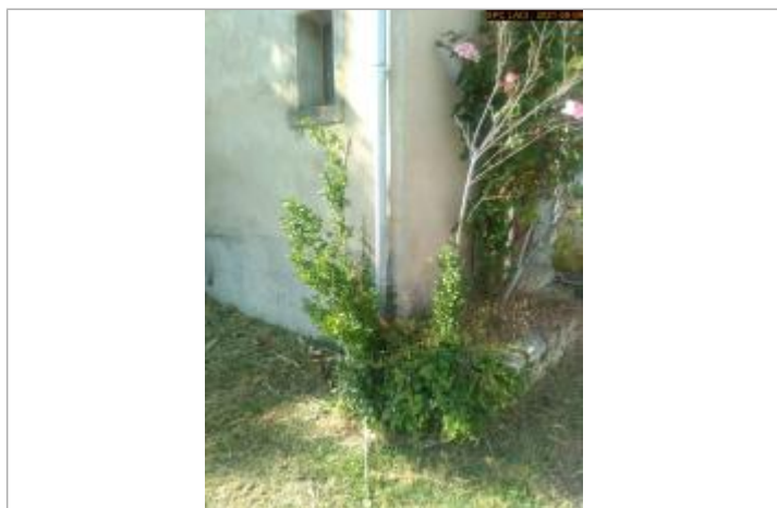
Vue du repère rapprochée en 2021