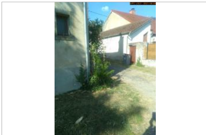
Vue du site en 2021