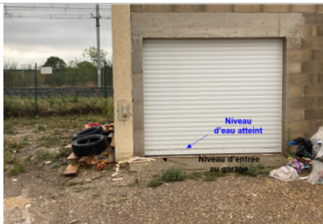
Niveau d'eau bien marqué sur le garage