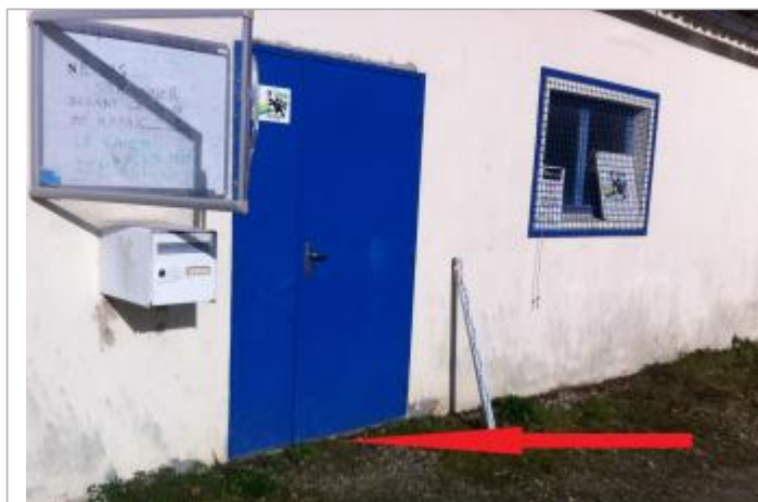
Niveau d'eau dans le bâtiment à partir du plancher

SOURCE DE REPÉRAGE : CAMPAGNE DE TERRAIN DHE 2015 - 26/02/2015