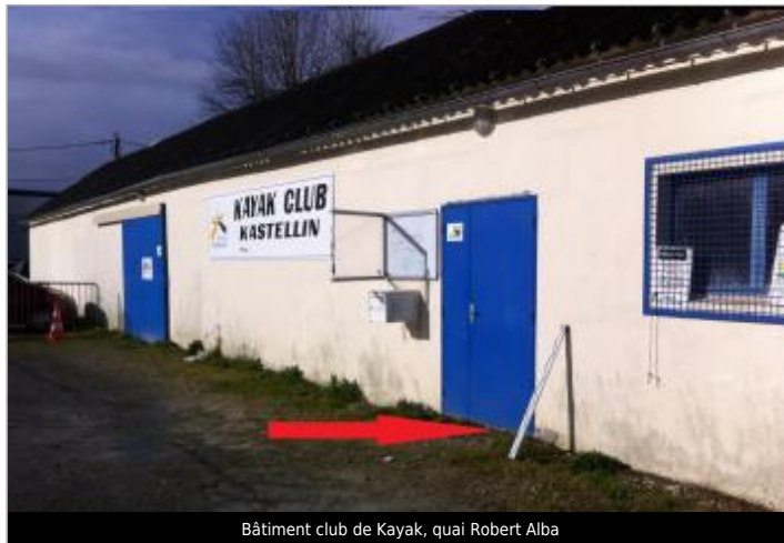
Bâtiment club de Kayak, quai Robert Alba