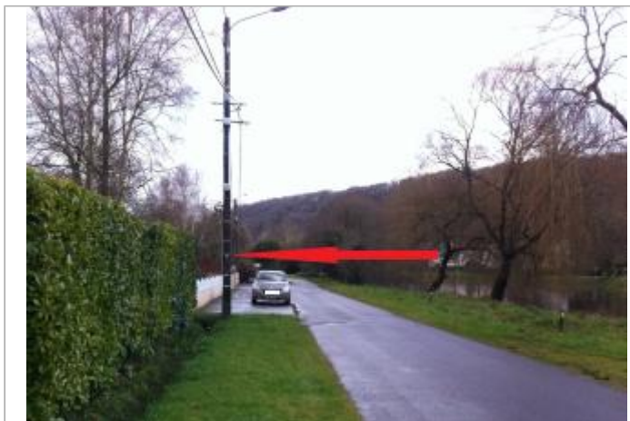
Pied de poteau électrique, route de Coatigaor