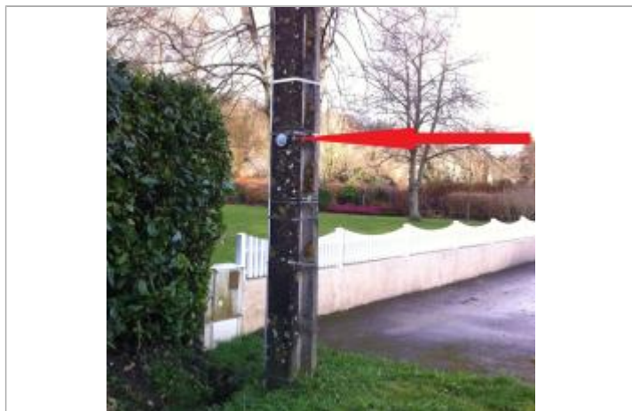
repère normalisé de la crue de décembre 2000

Altitude calculée de l'eau (en m) : 6.63