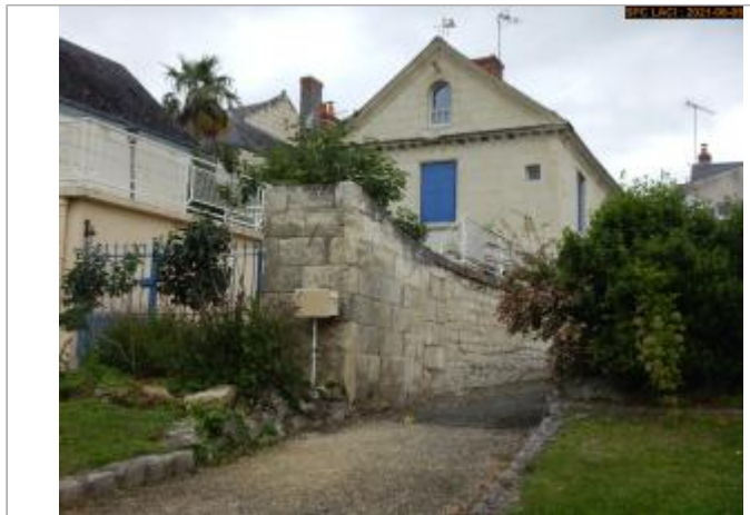
Vue du site en 2021

Coordonnées WGS84 : X: 0.12881940 / Y: 47.23677990