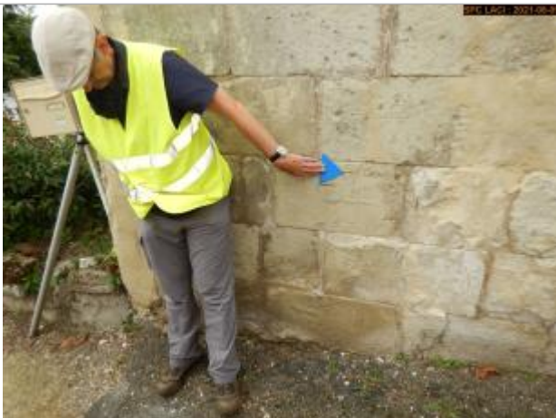
Vue du repère en 2021

Altitude calculée de l'eau (en m) : 34.087 m