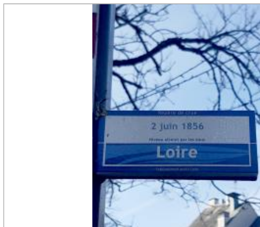
Photo rapprochée du repère, en février 2022