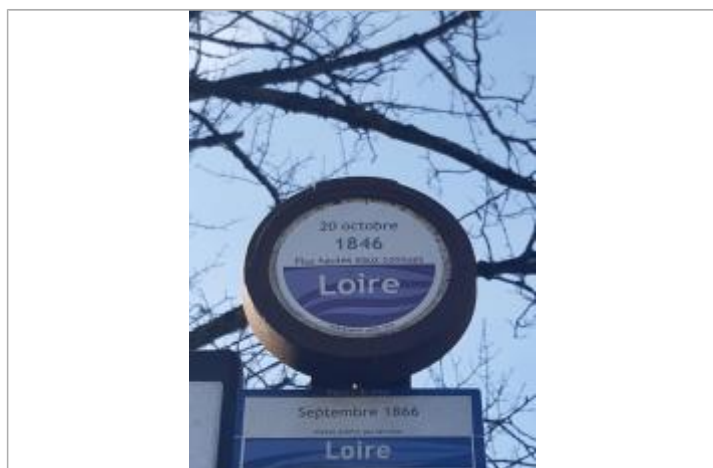
Photo rapprochée du repère, en février 2022