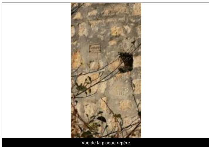
Vue de la plaque repère

Texte : Crue de 1876 Maximum de l'inondation : Oui Visibilité : Oui État du repère : Bon Pérennité : Longue