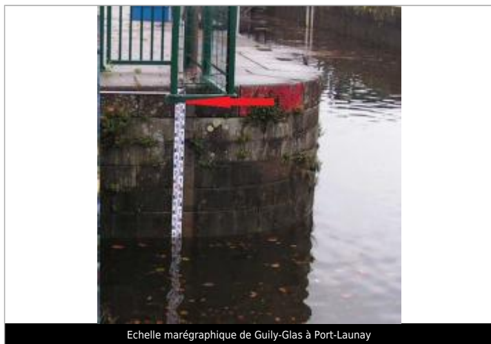
Echelle marégraphique de Guily-Glas à Port-Launay

Altitude calculée de l'eau (en m) : 5.13 m