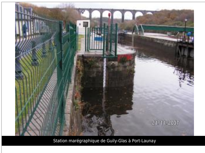
Station marégraphique de Guily-Glas à Port-Launay