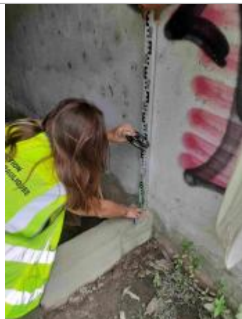
Niveau mesuré depuis un rebord béton sous le bâtiment

Altitude calculée de l'eau (en m) : 4.07