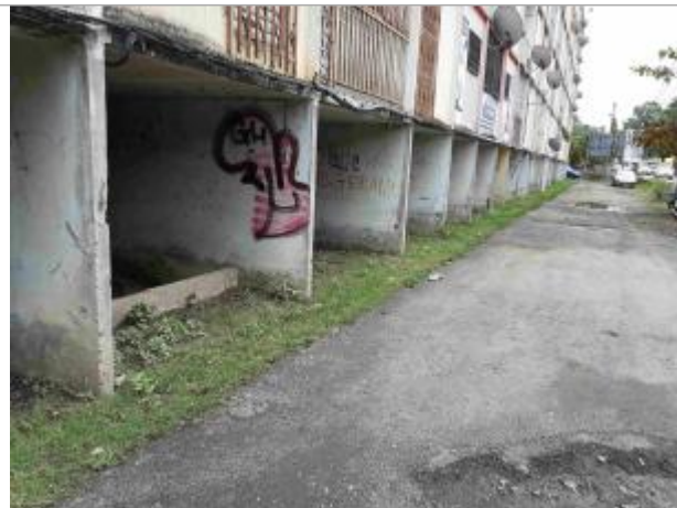
Immeuble - Route de Chauvel

Coordonnées RGF93 (ETRS89) : X: -61.521241 / Y: 16.239479