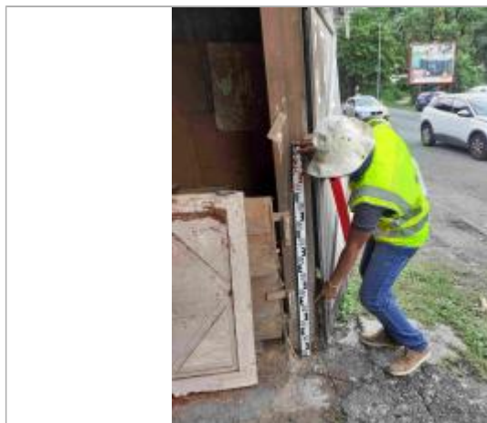
Trace sur angle de la porte d'entrée de la menuiserie à angle du rond point - Référence : sol

Altitude calculée de l'eau (en m) : 4.08 m