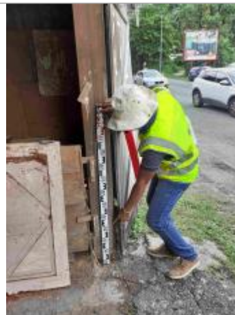
Route de chauvel / Boulevard de l'hopital (menuisier à angle du rond point)

Coordonnées RGF93 (ETRS89) : X: -61.521974 / Y: 16.239364