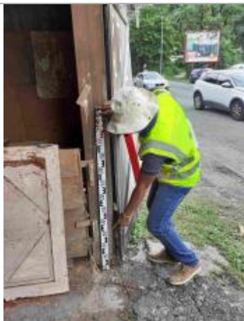
Trace sur angle de la porte d'entrée de la menuiserie à angle du rond point - Référence : sol

Altitude calculée de l'eau (en m) : 4.08