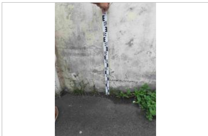
Ecole Raymonde Bambuck (entrée à l'intérieur - Au droit du portail) - Référence au sol

Altitude calculée de l'eau (en m) : 3.07 m