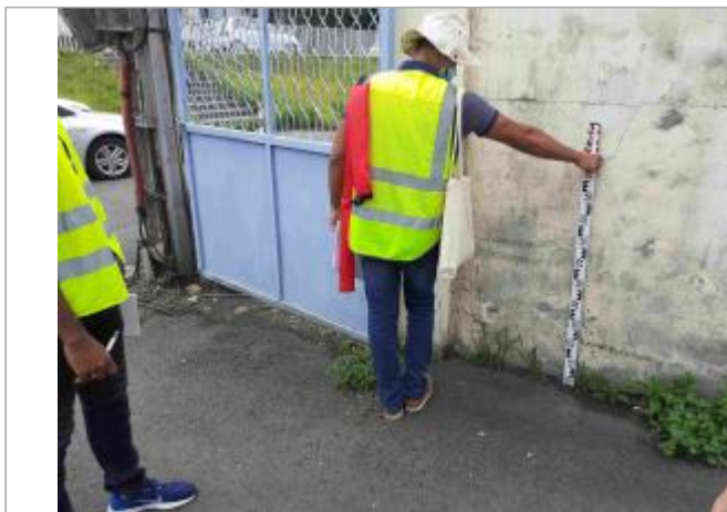
Ecole Raymonde Bambuck (entrée à l'intérieur au droit du portail)