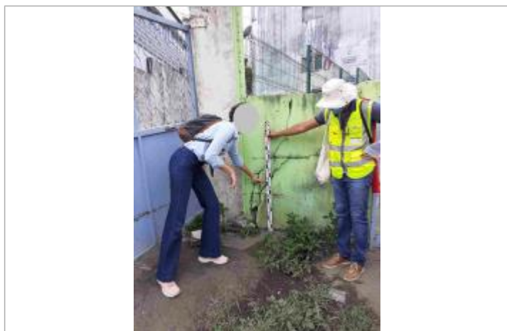
Ecole Raymonde Bambuck (entrée à coté du portail)

Altitude calculée de l'eau (en m) : 3.17