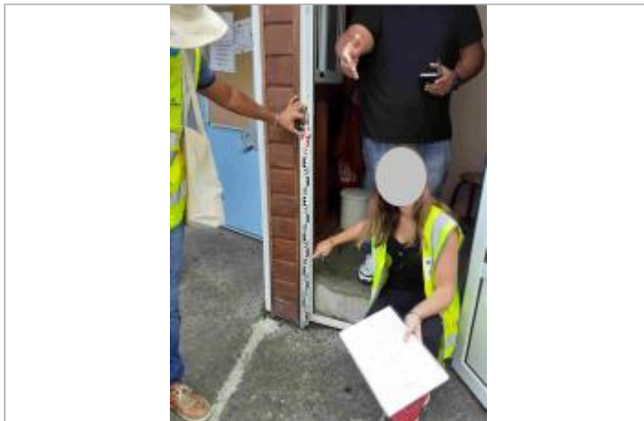
Collège de Massabielle