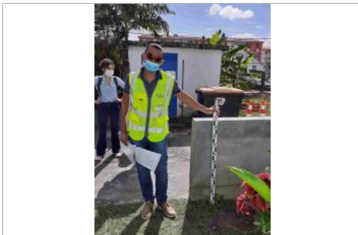
Ecole élémentaire Front de Mer