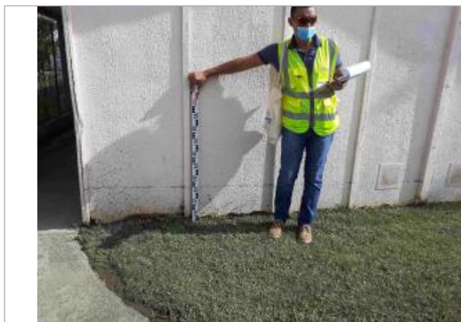
Salle de classe de l'école élémentaire Front de Mer

Altitude calculée de l'eau (en m) : 0.76 m