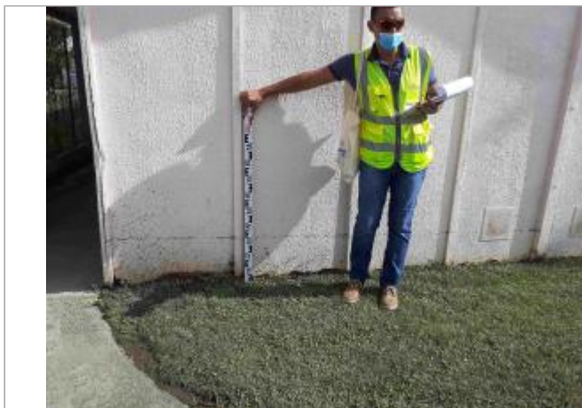
Ecole élémentaire Front de Mer

Coordonnées WGS84 : X: -61.54411700 / Y: 16.24862650