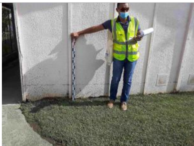
Salle de classe de l'école élémentaire Front de Mer

Altitude calculée de l'eau (en m) : 0.76