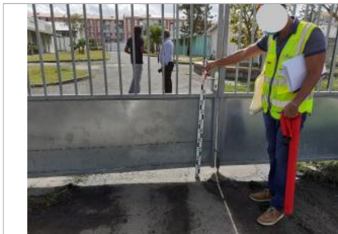
Portail entre le collège et l'école élémentaire

Altitude calculée de l'eau (en m) : 0.72 m