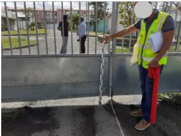
Portail entre le collège et l'école élémentaire

Altitude calculée de l'eau (en m) : 0.72