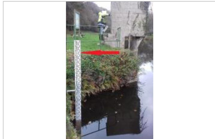
Echelle limnimétrique de la station de l'Hyère

GÉNÉRAL Code : SPC_29029_01_1999 Date de mise à jour : 10/02/2022 Auteur : SPC VCB