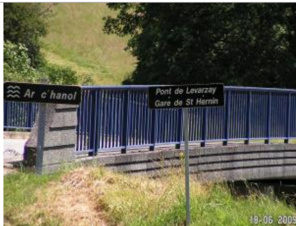
Pont de Levarzay - site de la station limnimétrique de l'Hyère