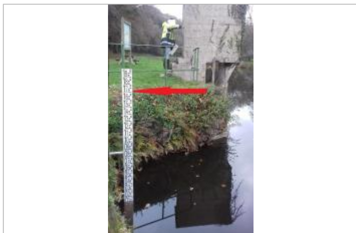
Echelle limnimétrique de la station de l'Hyère