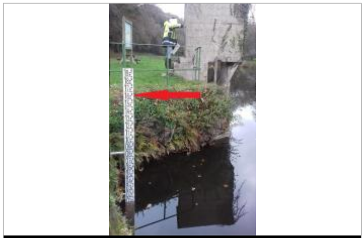
Echelle limnimétrique de la station de l'Hyère

GÉNÉRAL Code : SPC_29029_01_2014 Date de mise à jour : 10/02/2022 Auteur : SPC VCB