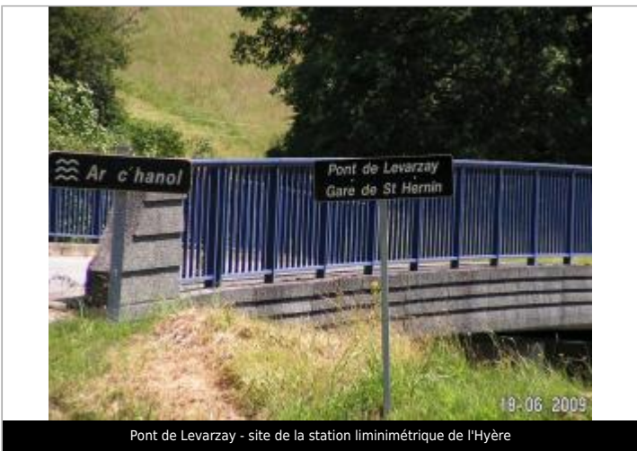
Pont de Levarzay - site de la station limnimétrique de l'Hyère

GÉOLOCALISATION Coordonnées WGS84 : X: -3.65522370 / Y: 48.22377600 Coordonnées RGF93 (Lambert 93) X: 206337.09 / Y: 6812308.09 Coordonnées RGF93 (ETRS89) : X: -3.6552237 / Y: 48.223776 Code Hydro: J37-0300 Rive de référence: Droite