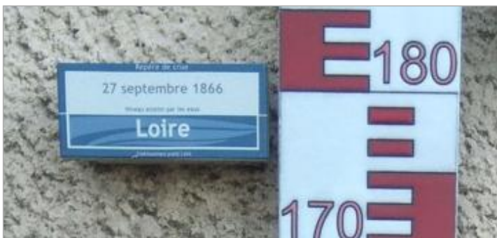
Vue du repère rapprochée en 2021