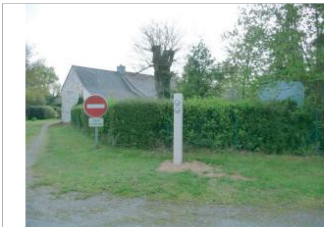
Poteau, Port Jarnier