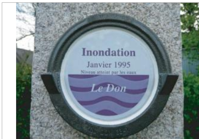
Repère normalisé de la crue de Janvier 1995

Code : RC DON 33-1_1995 Date de mise à jour : 16/12/2022 Auteur : SPC VCB