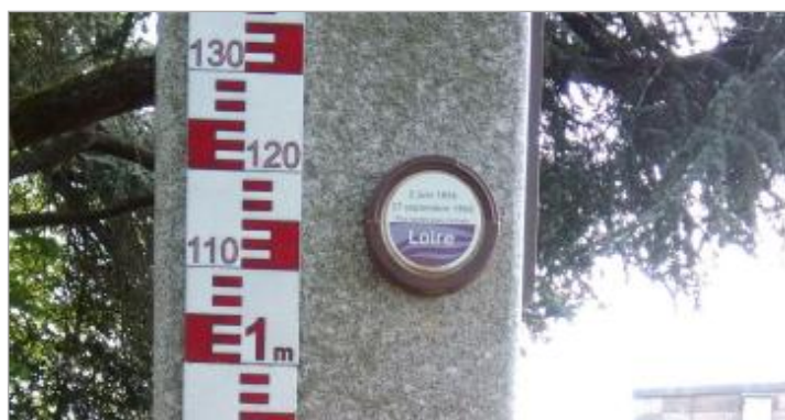
Vue du repère rapprochée