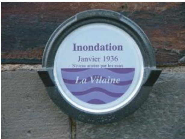
repère normalisé de la crue de janvier 1936

Altitude calculée de l'eau (en m) : 5.24 m