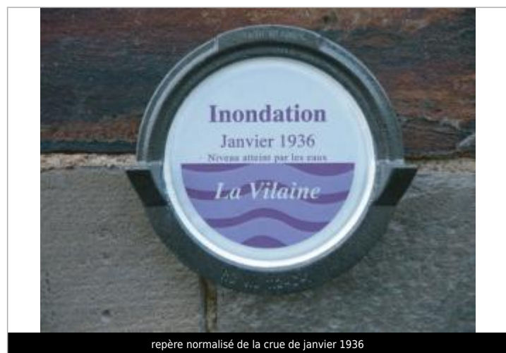
repère normalisé de la crue de janvier 1936