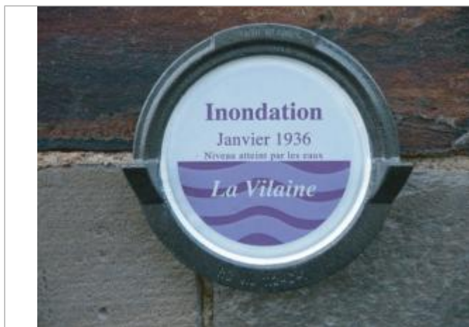
repère normalisé de la crue de janvier 1936

Altitude calculée de l'eau (en m) : 5.24 m