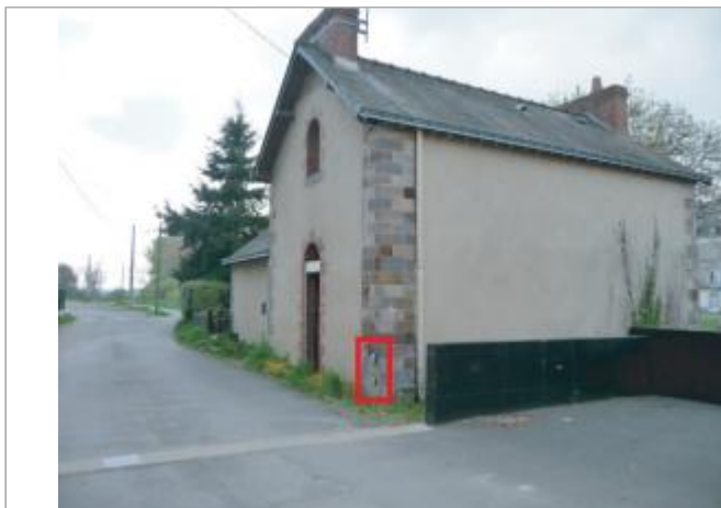
Maison individuelle, 5 rue de la Vilaine