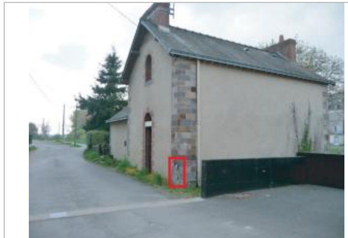
Maison individuelle, 5 rue de la Vilaine