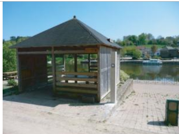
Poteau, Le Patis Vert