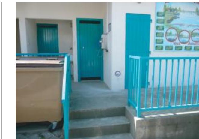
Local Sanitaire, Halte de Beslé