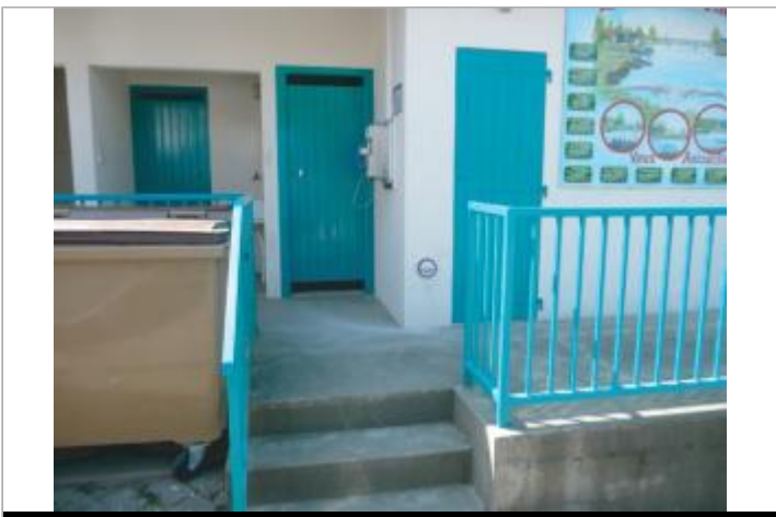
Local Sanitaire, Halte de Beslé

GÉOLOCALISATION Coordonnées WGS84 : X: -1.86716290 / Y: 47.70103400 Coordonnées RGF93 (Lambert 93) : X: 335192.53 / Y: 6744651.66 Coordonnées RGF93 (ETRS89) : X: -1.8671629 / Y: 47.701034 Code Hydro: J---0060 Rive de référence: Gauche