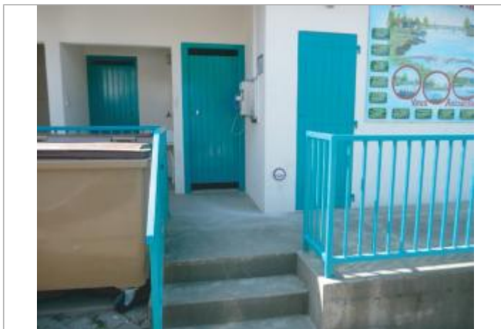
Local Sanitaire, Halte de Beslé