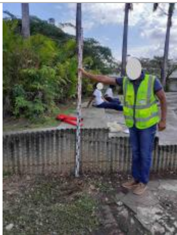
Référence au pied des escaliers

Altitude calculée de l'eau (en m) : 0.68 m