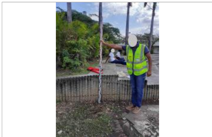
Référence au pied des escaliers

Altitude calculée de l'eau (en m) : 0.68 m