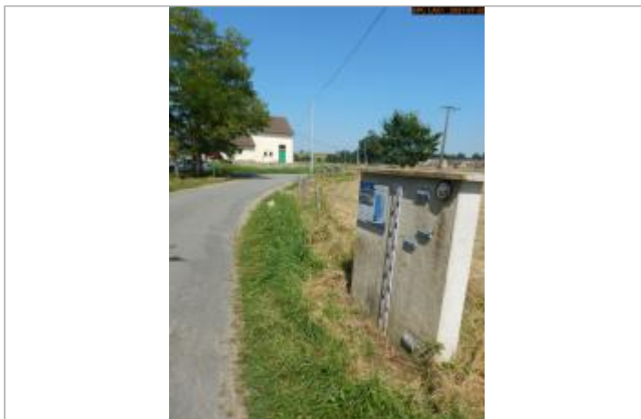
Vue du site rapprochée