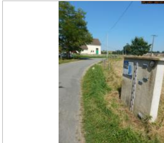
Vue du site rapprochée