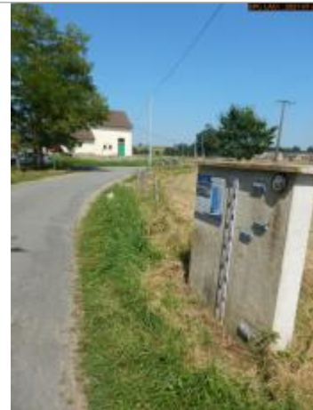
Vue du site rapprochée

Coordonnées WGS84 : X: 3.68941580 / Y: 46.68095100