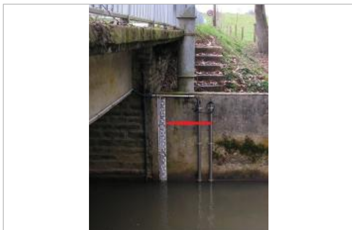
Echelle limnimétrique sous le pont

Maximum de l'inondation : Oui Visibilité : Non État du repère : Bon Pérennité : Longue Repère calculé : Non PHEC : Non