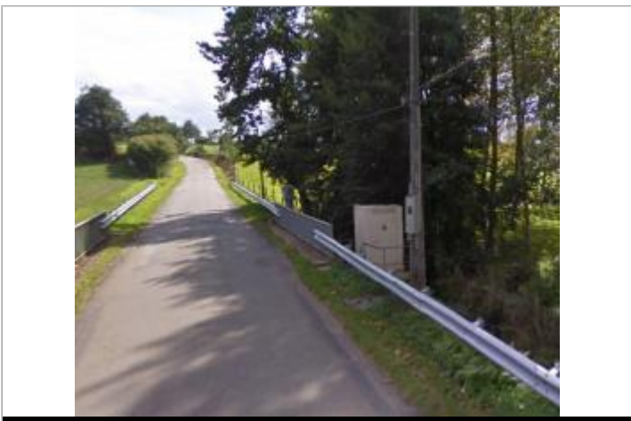
Station limnimétrique de la Valière à Erbrée en 2011

GÉOLOCALISATION Coordonnées WGS84 : X: -1.12651990 / Y: 48.10892200 Coordonnées RGF93 (Lambert 93) X: 393018.17 / Y: 6786750.91 Coordonnées RGF93 (ETRS89) : X: -1.1265199 / Y: 48.108922 Code Hydro: J7024000 Rive de référence: Gauche