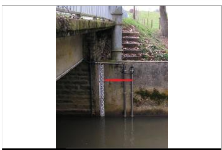
Echelle limnimétrique sous le pont

GÉNÉRAL Code : SPC_35105_01_2012 Date de mise à jour : 03/02/2022 Auteur : SPC VCB