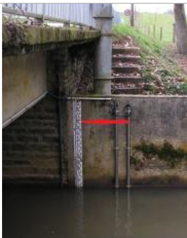
Echelle limnimétrique sous le pont

Altitude calculée de l'eau (en m) : 90.087 m