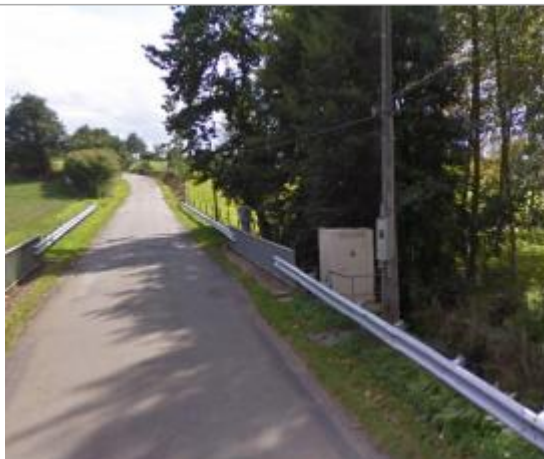
Station limnimétrique de la Valière à Erbrée en 2011

Coordonnées WGS84 : X: -1.12651990 / Y: 48.10892200