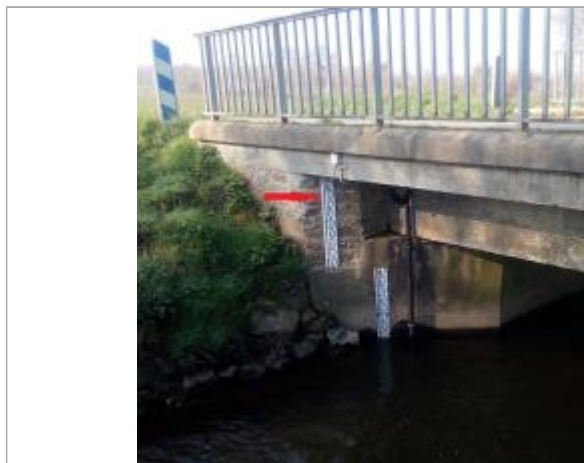
Echelle limnimétrique sous le pont coté Bourgon