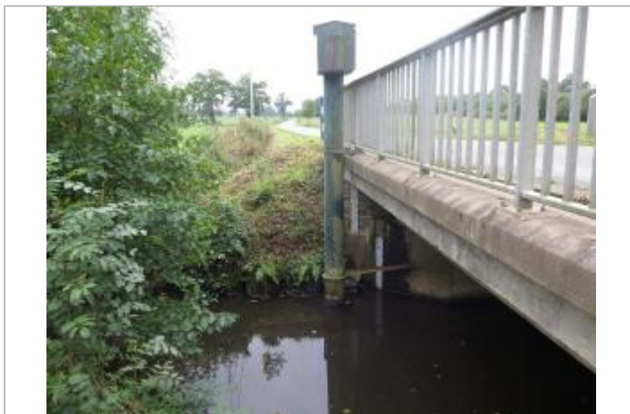
Station limnimétrique de la Vilaine à Bourgon en 2017