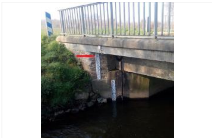
Echelle limnimétrique sous le pont coté Bourgon