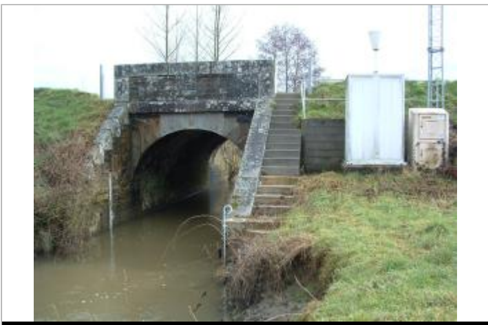
Station limnimétrique de la Cantache à Taillis (coté échelle)

GÉOLOCALISATION Coordonnées WGS84 : X: -1.22496200 / Y: 48.16275530 Coordonnées RGF93 (Lambert 93) X: 386021.68 / Y: 6793112.22 Coordonnées RGF93 (ETRS89) : X: -1.224962 / Y: 48.1627553 Code Hydro: J70-0300 Rive de référence: Droite