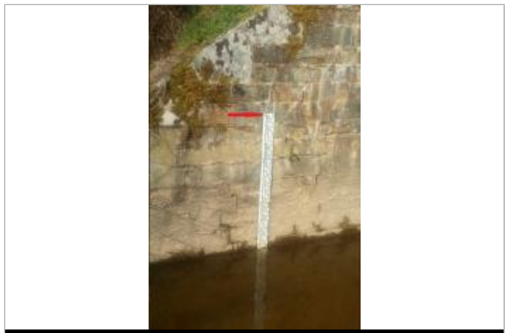
Echelle limnimétrique sous le pont coté Taillis

GÉNÉRAL Code : SPC_35330_01_2012 Date de mise à jour : 15/04/2025 Auteur : SPC VCB