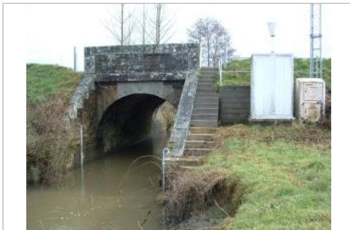
Station limnimétrique de la Cantache à Taillis (coté échelle)