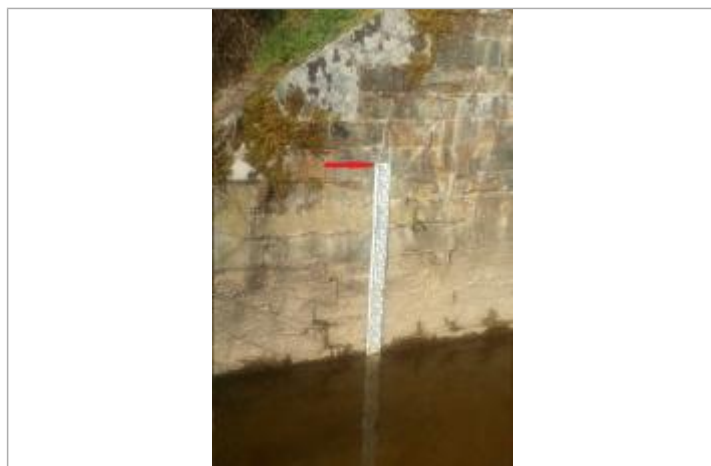
Echelle limnimétrique sous le pont coté Taillis

Altitude calculée de l'eau (en m) : 75.661 m