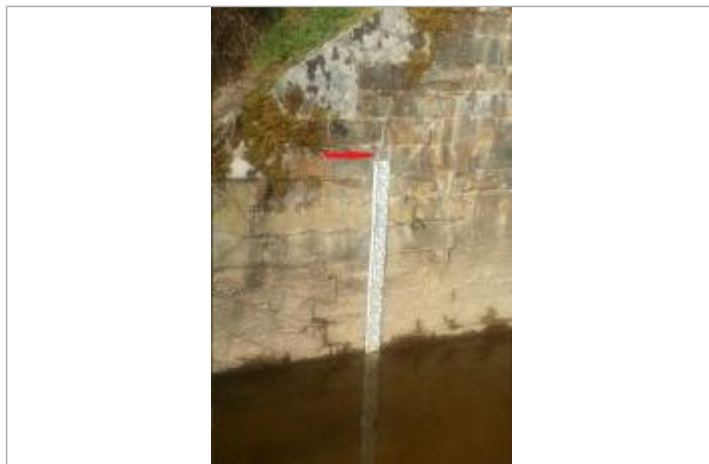
Echelle limnimétrique sous le pont coté Taillis

Altitude calculée de l'eau (en m) : 75.721 m