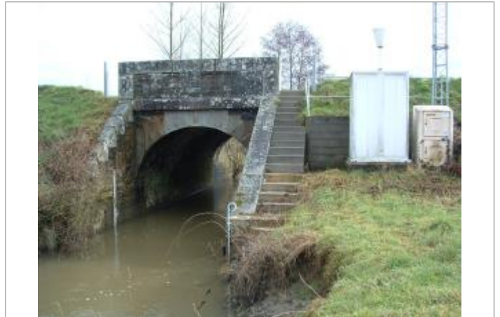
Station limnimétrique de la Cantache à Taillis (coté échelle)