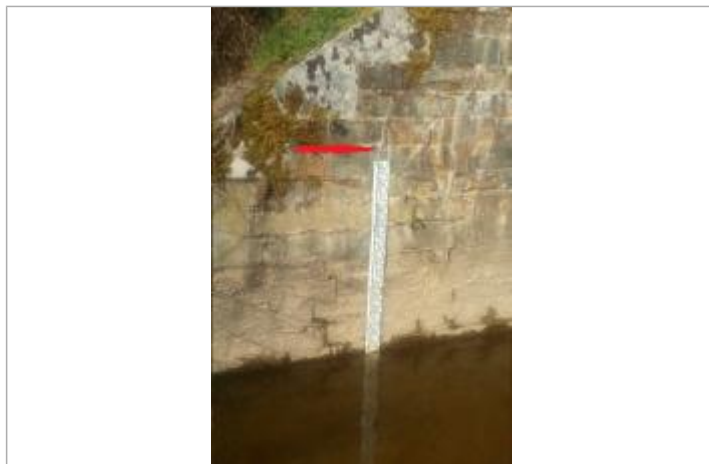
Echelle limnimétrique sous le pont coté Taillis

Altitude calculée de l'eau (en m) : 75.751 m