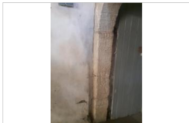
Vue des repères