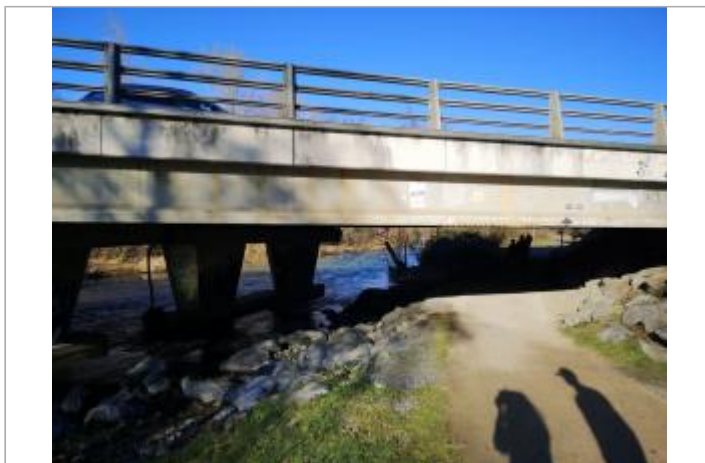
Vue du site - Auteur : Schapi