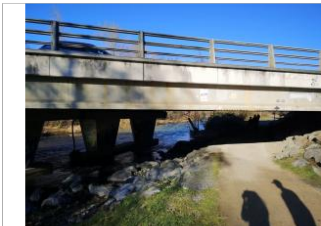
Vue du site - Auteur : Schapi

Coordonnées WGS84 : X: 0.09291170 / Y: 43.21537420