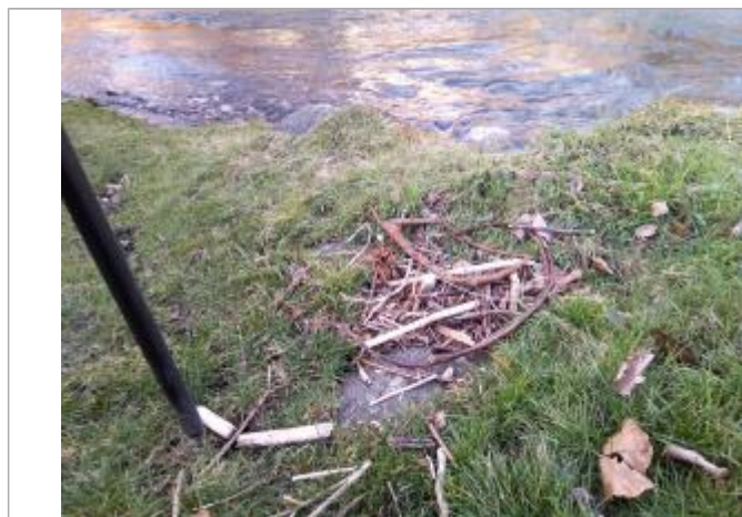
Vue de la lisse - Auteur : SPC GAD