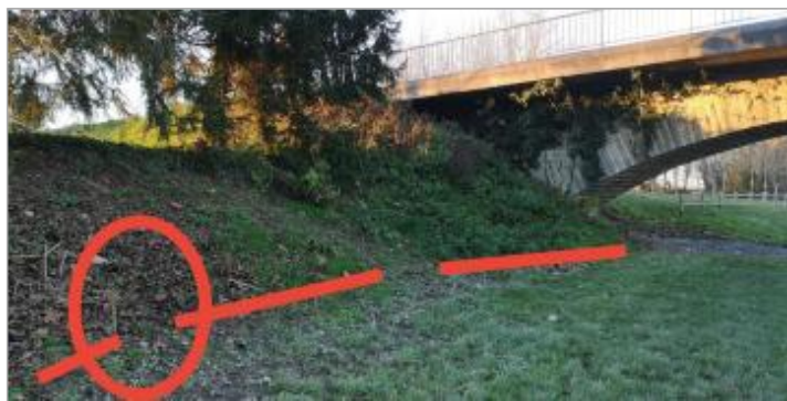
Vue de la laisse - Auteur : Schapi