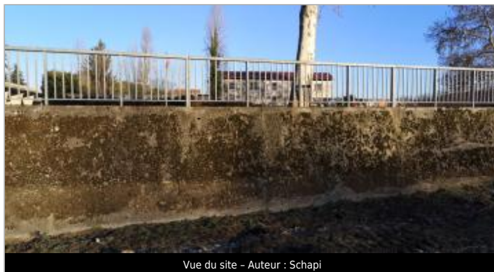
Vue du site - Auteur : Schapi