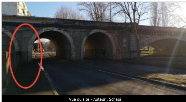
Vue du site - Auteur : Schapi