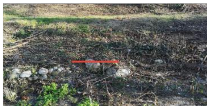
Vue de la laisse - Auteur : Schapi

GÉNÉRAL Code : GAD_ADA21_R_11_1 Date de mise à jour : 07/07/2022 Auteur : SPC GAD