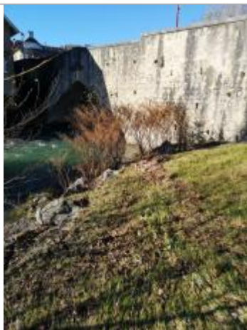
Vue de la laisse - Auteur : Schapi

Altitude calculée de l'eau (en m) : 432.64 m